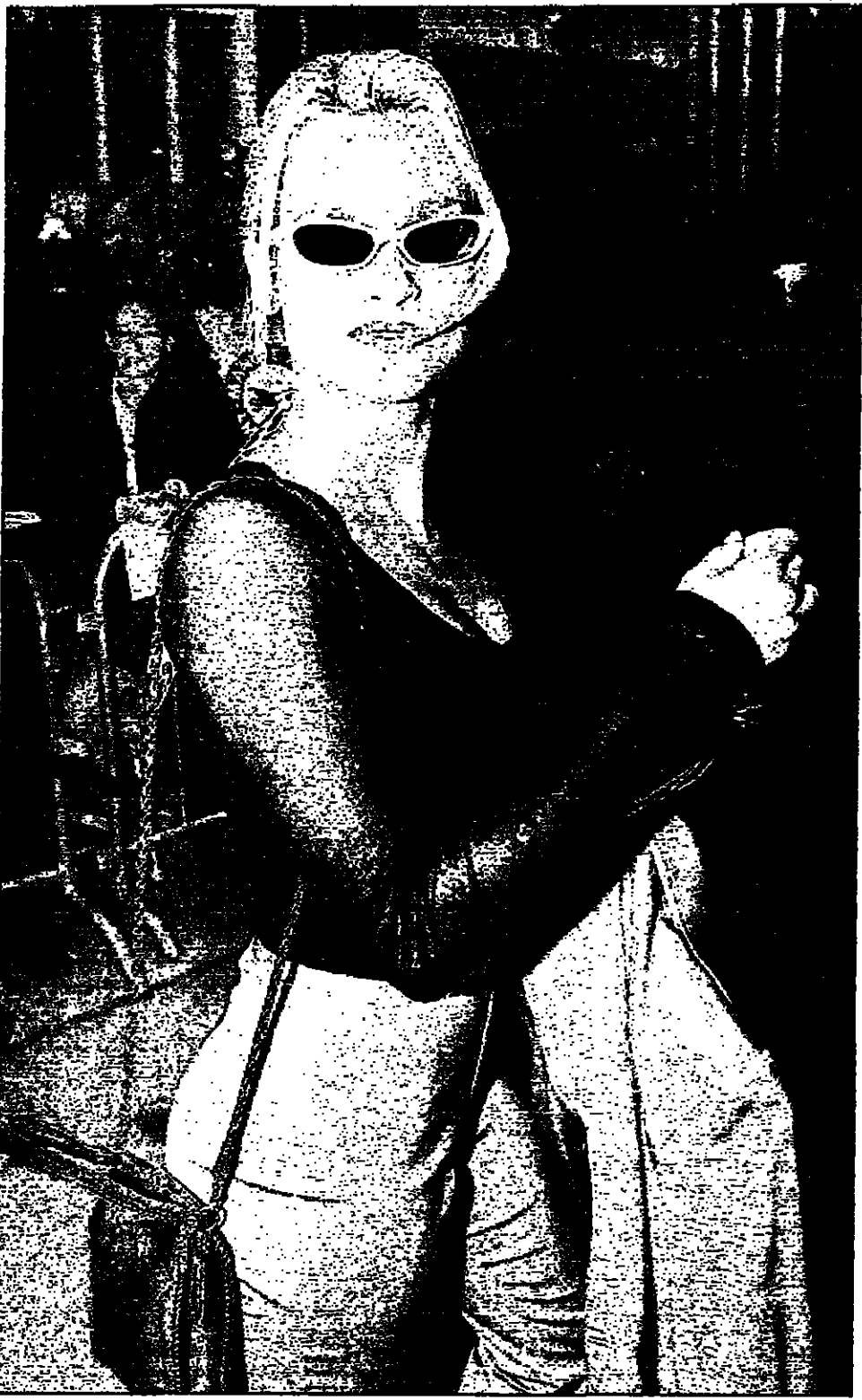
الجمعة تكريمت شويديان حضرت حفل العرض الاول لفيديا الجديد الفقة الجوية في لوس انجلوس امس الاول